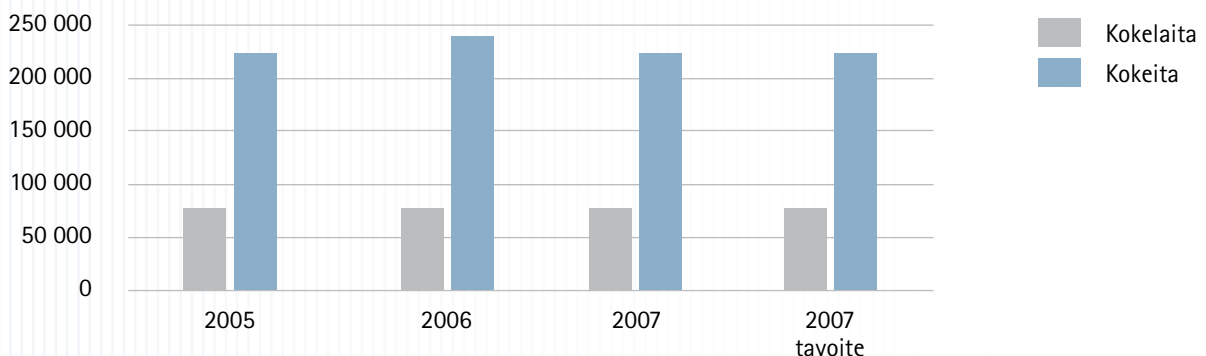
Ilmoittautumiset ylioppilastutkintoon 2005–2007

Vuonna 2007 valittiin uusi 38-jäseninen lautakunta. Lautakunnalla on myös apujäseniä, jotka toimivat lähinnä koesuoritusten arvostelijoina eli